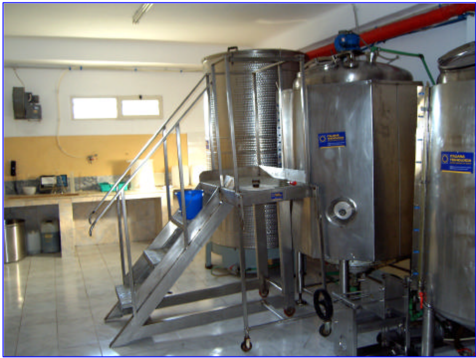
Laboratorio per certificazione di qualità